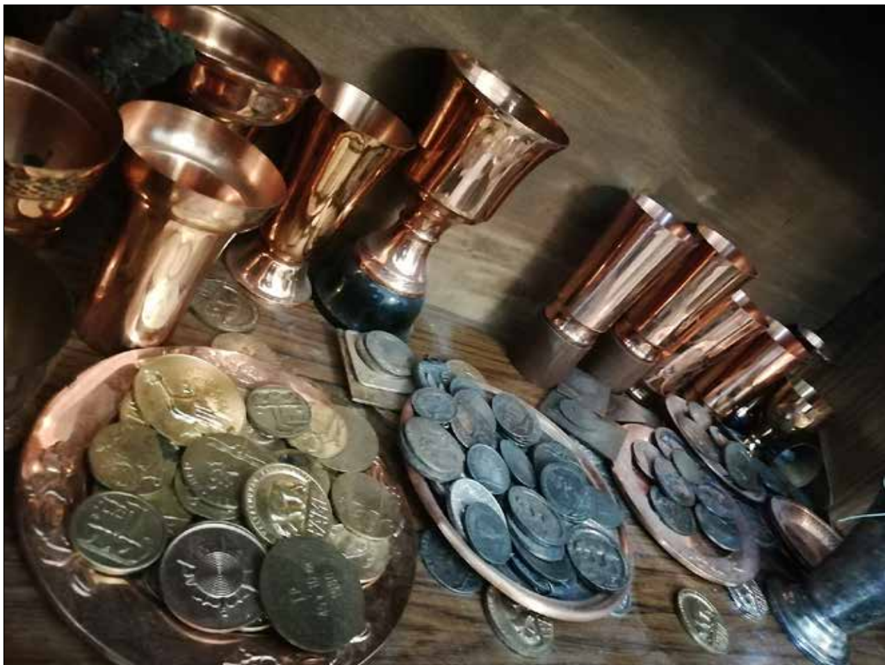
Mitalia ja pystiä riittää joka lähtöön. Kiiltävän metallin lisäksi ladun varrelta on vuosien saatossa tarruttanut mukana mielenkiintoisia tarinoita ja erikoisia saavutuksia.

Hiihtoliiton kehittämistä sokerisesta juomasta Mäkisellä ei ole positiivista sanottavaa.