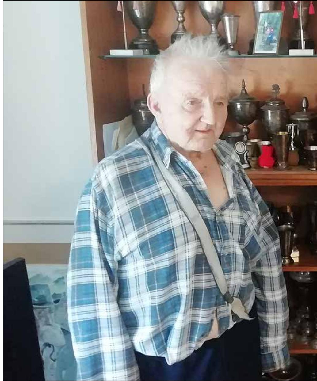
Virkeässä kunnossa oleva hiihtomestari viihtyy kotonaan Hoppasissa. Joulukuun 2023

– Olin kuullut vanhoilta hiihtäjiltä, että viimeiselle viidelle kilometrille on