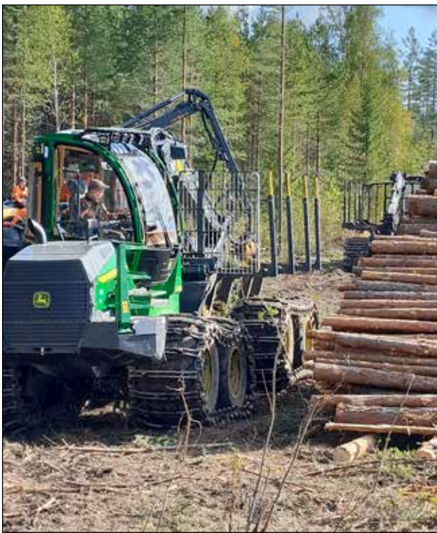
Tekemällä oppii. Opiskelijat pääsevät Metsätien toimipisteellä harjoittelemaan käytännön töitä aidoissa ympäristöissä ensimmäisestä opiskeluvuodesta alkaen.