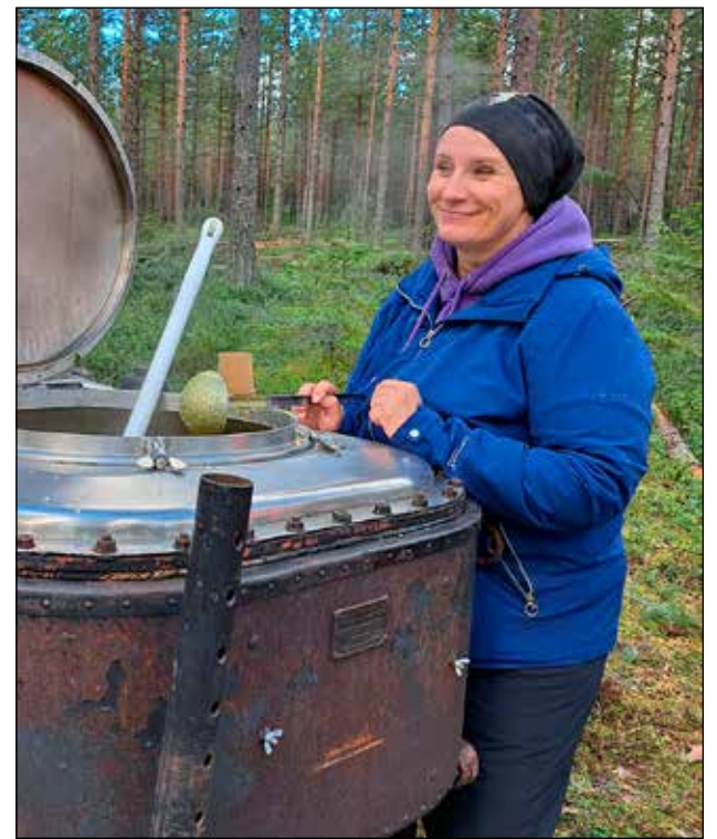
MetsäGroup tarjosi ja Tredun Metsätien toimipisteen oppilaitosravintola Silmu toteutti päivän maistuvat tarjoilut. Aurinkoisessa syysässä hymy oli herkässä.