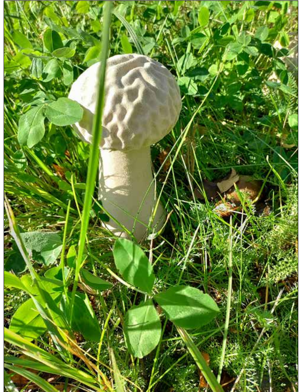
Kuruun vastikään muuttanut Heli lähetti kuvan toimitukseen ja tiedustelee mikä tämä sieni mahtaa olla? Sieni on lähes 30 cm korkea ja löytyi Virastien varrelta aivan asfalttitiien vierestä.