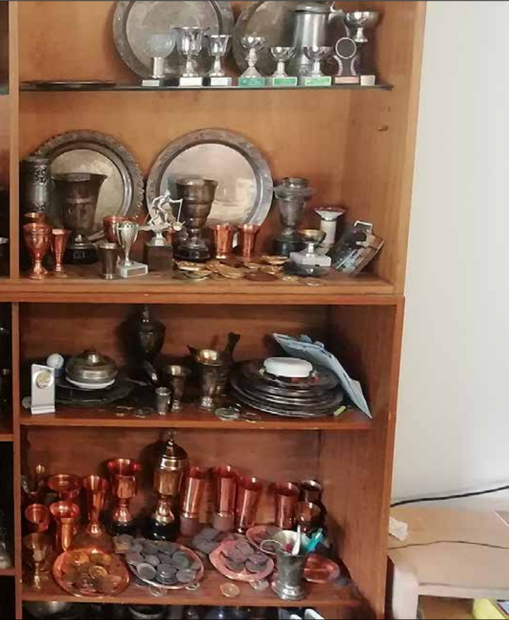
ussa on määrä juhlia 90-vuotissyntymäpäiviä.

– Minulta meni kaksi 50 kilometrin hiihtoa pilalle se takia. Se oli siinä seitsemän kilometrin paikkeilla, kun ne tarjosivat minulle sitä juomaa. Se oli ihan sellaista sokerimössöä. Huoltomies sanoi vielä,