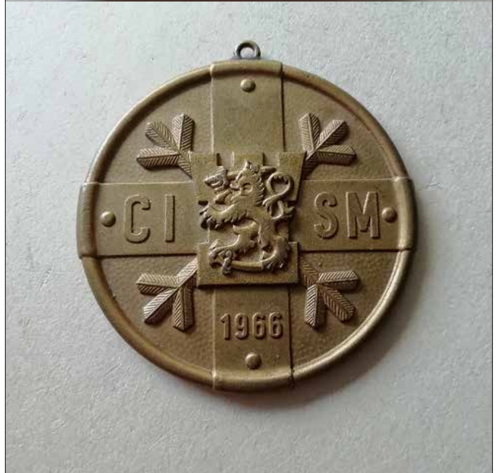
Menestystä on tullut sekä aktiiviuran huippuvuosina että ikämiehissä.