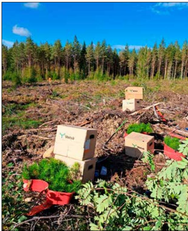
Aurinkoinen syyspäivä sopi mainiosti myös taimien istutukseen. Tapahtuman aikana yleisö sai kattavan kuvan metsänhoidon työvaiheista istutuksesta harvennuksiin ja koneelliseen puunkorjuuseen.