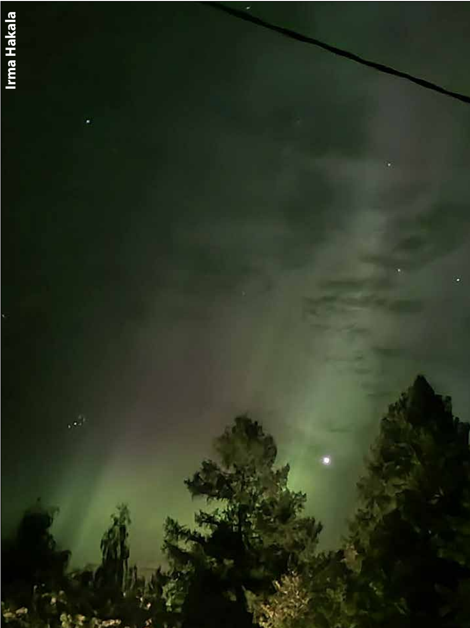
Revontulet loimusivat upeissa väreissä Kurun taivaalla maanantai-iltana.